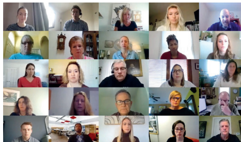
Neues Wissen erarbeiten: Zoom-Inputs am Weiterbildungstag für Kursleitende.