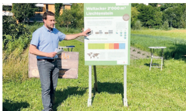
Teilen wir die Ackerfläche dieser Welt durch ihre Bewohner, ergibt es 2000m 2 pro Mensch. Darauf muss alles wachsen, was wir verbrauchen.

Corona hat uns viele Änderungen im Alltag beschert. Auch den vermehrten Einsatz des PCs und Handys bzw. Tablets. Deshalb hat die Nachfrage nach IT-Kursen in der zweiten Hälfte des Jahres deutlich zugenommen. Das Angebot umfasste 40 Kurse (Vj 43), von denen 24 (Vj 21) durchgeführt werden konnten. Die Durchführungsquote von 60 Prozent liegt 11 Prozent über dem Vorjahresniveau. Wie Lesen, Schreiben und Rechnen gehören heute IT-Kenntnisse zu den Kulturtechniken der Menschen. Kompetenz am Computer ist keine Frage des Alters, sondern ein nützliches Werkzeug für alle Generationen. Insgesamt nutzten 96 Personen (Vj 88) unser mehrteiliges IT-Angebot. Auf hohes Interesse stiessen die Zoom-Workshops und Angebote, die sich an die Handy-Zielgruppe richteten (iPhone I/II, Android-Smartphone, Homepage erstellen, eBay und Ricardo).