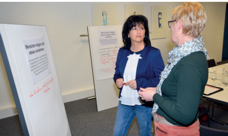
Mitgestalten, mitdenken und realisieren. Der Beirat setzt Impulse.