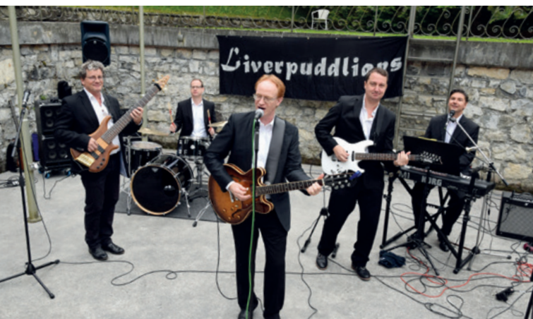
Sommerlicher Kulturtreff im Park: für jeden Geschmack.

Ende April nahmen 60 Kursleitende am halbtägigen Zoom-Workshop teil. Die Teilnehmenden lernten die Technik kennen, wie sie mit Zoom erfolgreich Web-Meetings übers Internet organisieren und durchführen können. Der konzeptionelle Mehraufwand für die Umgestaltung von Präsenz- auf Digitalunterricht auf Dozentenseite wurde kurz thematisiert und ist Teil von weiteren Workshops. Mit diesem Angebot bedient das Haus den von der Edu-Qua formulierten Bedarf, medienpädagogische Kompetenzen in der Qualifizierung des Weiterbildungspersonals im digitalen Zeitalter zu verankern.