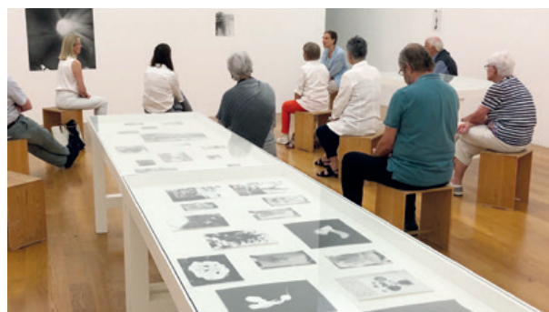
Kunst am Mittag: ein Kunstwerk im Detail erklärt